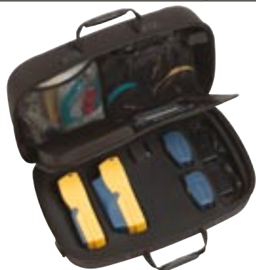
Полный набор DTX Compact OTDR для сертификации и устранения неисправностей