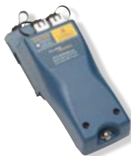
Модуль DTX Compact OTDR